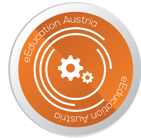
ENTWICKELN UND ERPROBEN VON E-LEARNING-SZENARIEN