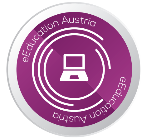
EINSATZ DIGITALER MEDIEN IM UNTERRICHT