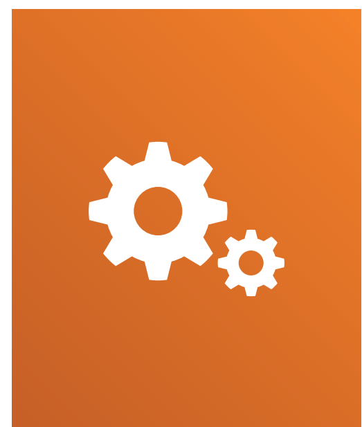
ENTWICKELN UND ERPROBEN VON E-LEARNING-SZENARIEN