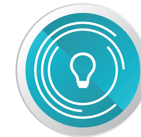
EINSATZ INNOVATIVER LERNMETHODEN