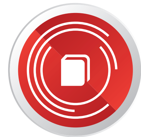
AKTIVE VERBREITUNG VON E-LEARNING INHALTEN