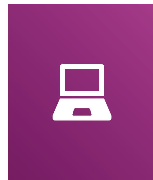
EINSATZ DIGITALER MEDIEN IM UNTERRICHT