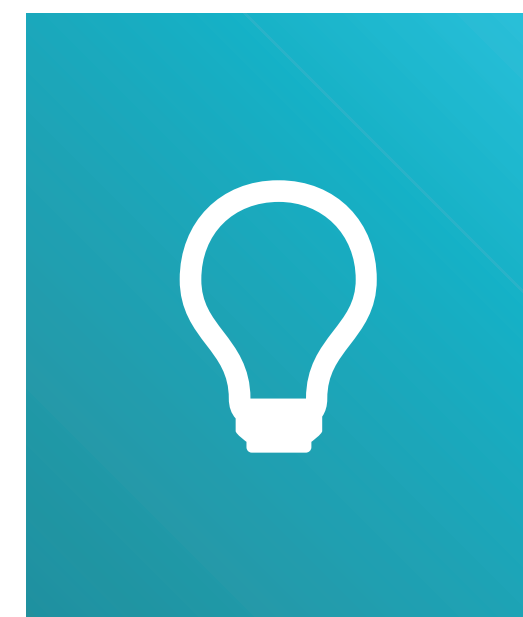
EINSATZ INNOVATIVER LERNMETHODEN