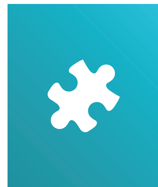
ERWERB DIGITALER KOMPETENZEN