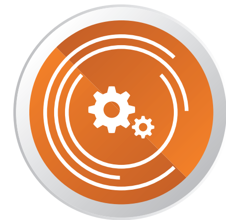
ENTWICKELN UND ERPROBEN VON E-LEARNING-SZENARIEN