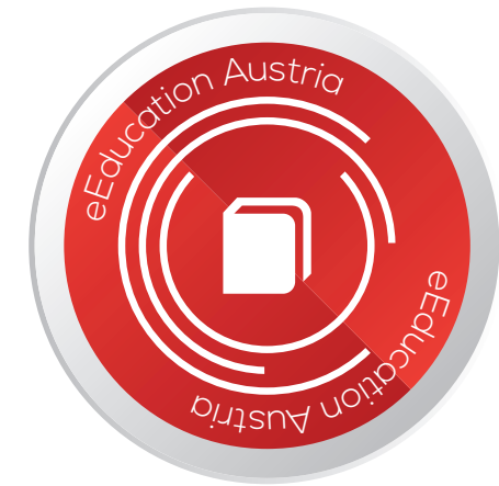
AKTIVE VERBREITUNG VON E-LEARNING INHALTEN