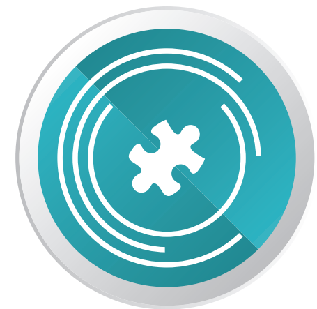
ERWERB DIGITALER KOMPETENZEN