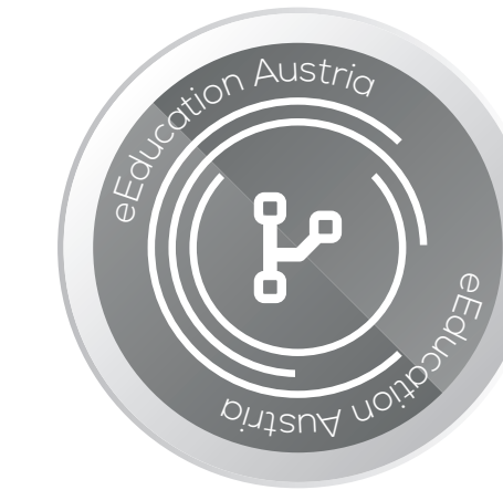
EINSATZ INNOVATIVER LERNTECHNOLOGIEN