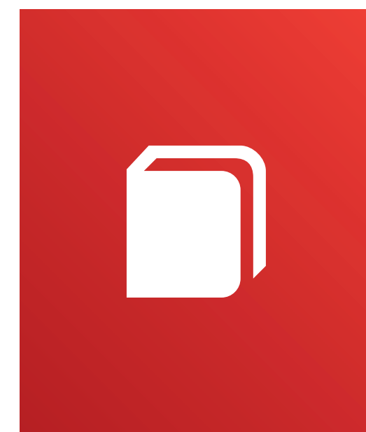
AKTIVE VERBREITUNG VON E-LEARNING INHALTEN