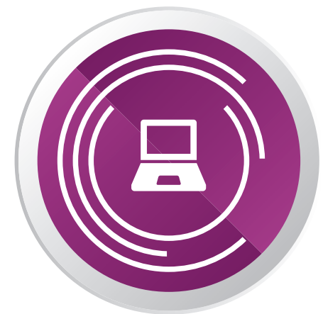
EINSATZ DIGITALER MEDIEN IM UNTERRICHT