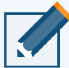
Material zum Selbststudium