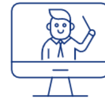
Digitale Endgeräte für Lehrerinnen und Lehrer