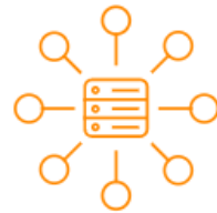
Ausbau der schulischen Basis-IT- Infrastruktur