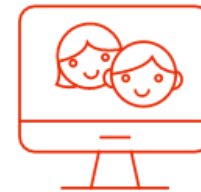
Digitale Endgeräte für Schülerinnen und Schüler