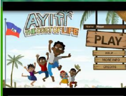
Ayiti The cost of Life