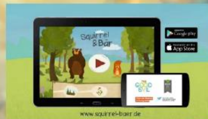
Squirrel & Bär