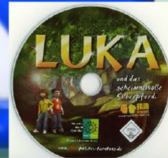
Luka und das geheimnisvolle Silberpferd