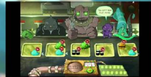
Lure of the Labyrinth