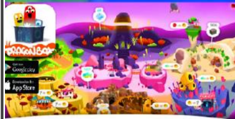
Thousands of math problems to solve Dragonbox Big Numbers