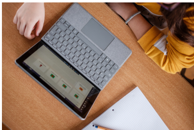
Paket 1: MS Teams für Anfänger:innen