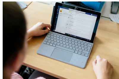
Paket 2: MS Teams für Fortgeschrittene